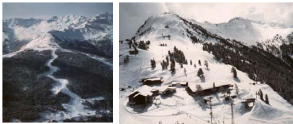
Piste de l'Ours